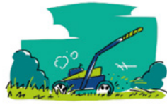
Tondre sans ramasser (mulching)

Grâce à cette méthode, vous protégez votre sol et lui apportez de l'engrais naturel.