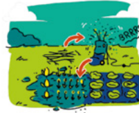
Broyer puis pailler

Ne les brûlez pas ! Vous pouvez les broyer afin de les utiliser comme paillage pour votre jardin. Cela protégera vos plantations tout en leur apportant un engrais naturel !